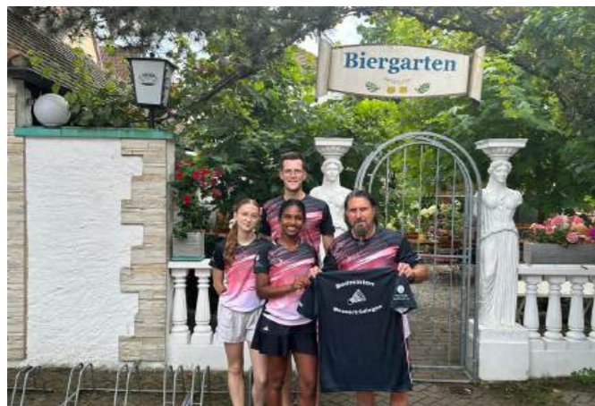
Neue Trikots für die Abteilung Badminton: Vielen Dank an die Taverna Margarita.

Wir freuen uns schon auf unseren Saisonstart mit den neuen Bällen und Trikots und hoffen auf spannende erfolgreiche Liga-Spiele.